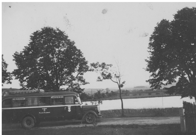
Foto: první německý autobus za okupace u nás