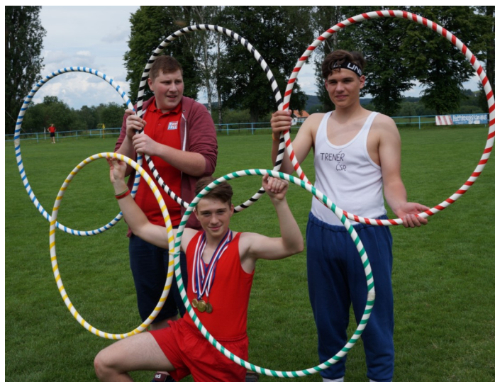
foto ze zahajovacího ceremoniálu OH

Poslední soutěží pro naše ratolesti školou povinné byl již druhý ročník Biatlonu v Chospílu. Jako vloni nám před zá-