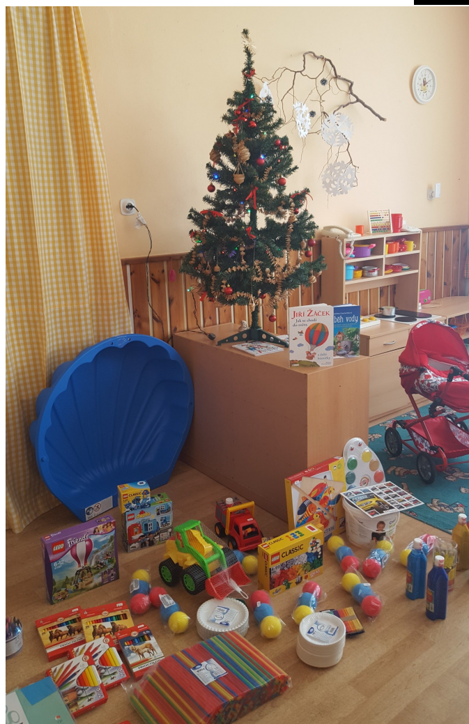
Foto: Vánoce ve školce

Čtení pohádky „O Vánocích, které nechtěly být“ nebylo náhodné. Děti se také začaly chovat nehezky, ale slíbily, že se polepší a taky se tak stalo. Ježíšek dorazil i k nám do MŠ. Jaké přinesl dárečky? Např.: různé stavebnice