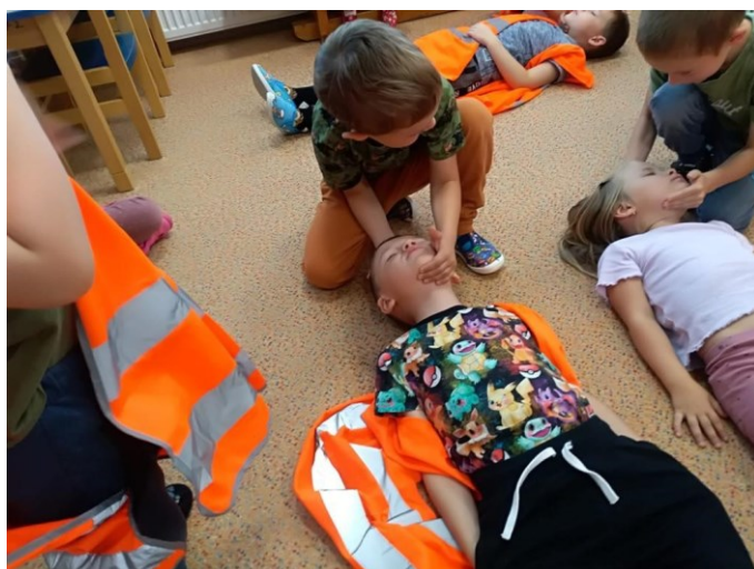
První pomoc zážitkem