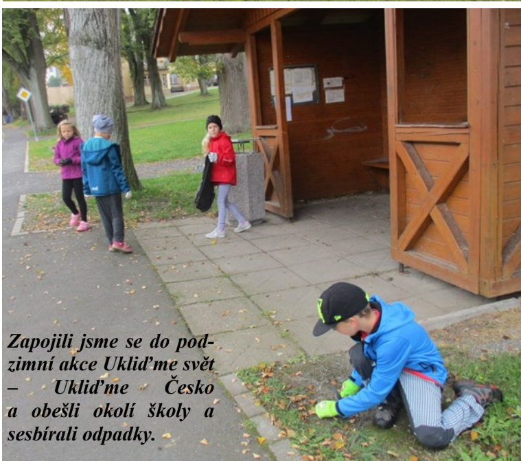
Zapojili jsme se do podzimní akce Uklid'me svět – Uklid'me Česko a obešli okolí školy a sesbírali odpadky.