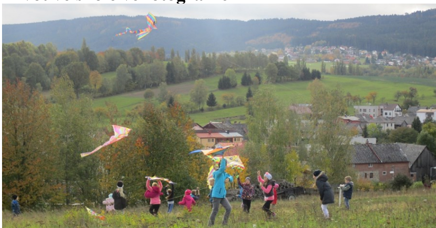
S družinou jsme pouštěli draky... ... a navštívili ZOO koutek v Domažlicích