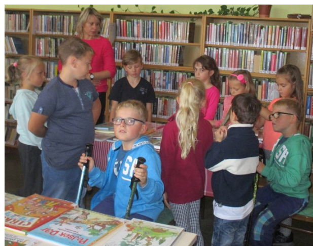
Žáci 2. ročníku navštívili místní knihovnu

Mnoho dalších fotografií naleznete na webových stránkách školy, v oddíle akce 2017/2018: http://zsms-postrekov.cz/20172018-zs/