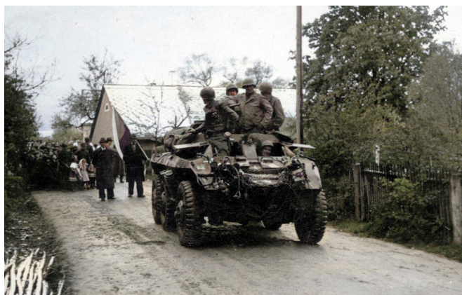
Archivní fotografie z vítání americké armády v Postřekově