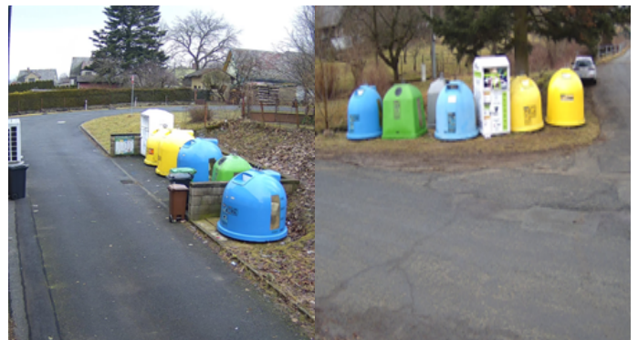
foto z kamerového systému