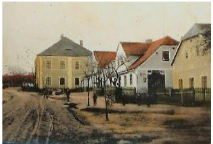
Popis shora: Obecná škola, dům u Ublů (bývala zde hospoda), dům u Mistrů (pošta), dům u Petřů.