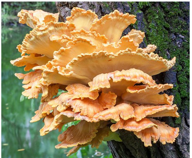
sírovec žlutooranžový

V misce připravíme zálivku z drobně nakrájené cibule, polévkové lžice octa, polévkové lžice hořčice, 2 polévkových lžic oleje, mleté papriky, pepře a soli. Do hotové omáčky vsypeme tepelně upravený květák a houby. Smícháme a ozdobíme nakrájenou petrželkou.